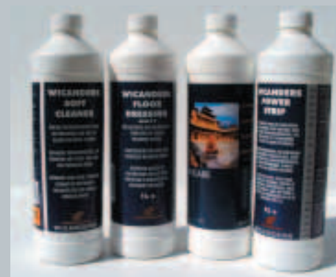
WICANDERS Reinigungs- und Pflegeprogramm