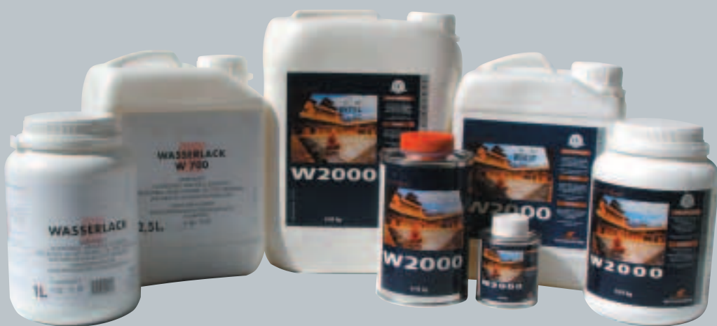
WICANDERS Wasserlack W700/W2000

Sollte die Oberfläche eines Korkbodenbelags dennoch einmal unansehnlich werden, kann man die Lackschicht auffrischen oder bei homogenen und vollflächig verklebten Korkböden sogar die komplette Lackschicht abschleifen und von Grund auf erneuern.