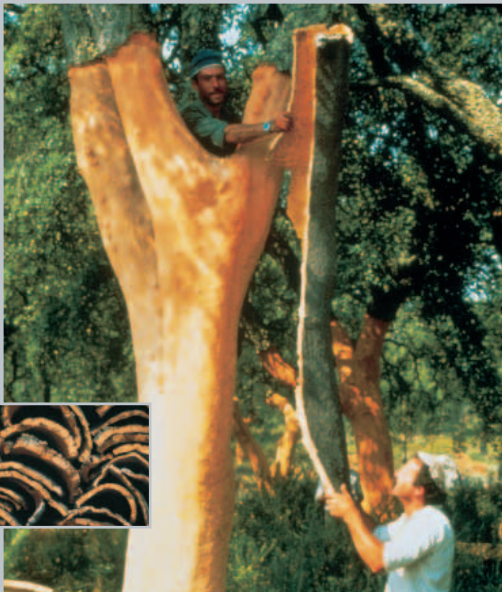
Die Korkrinde wird in großen Platten vom Baum gelöst

Die „machado“ ist das wichtigste Werkzeug der Korkschnneider