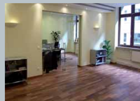
Zum Einsatz kamen SERIES 4000-Korkböden mit Ahorn- und Mahagonifurnier.