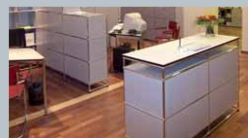
Die Musterverlegung mit einem Innenfries aus Ahorn betont besonders die vier Beratungstische als Herzstück des Empfangsraums.